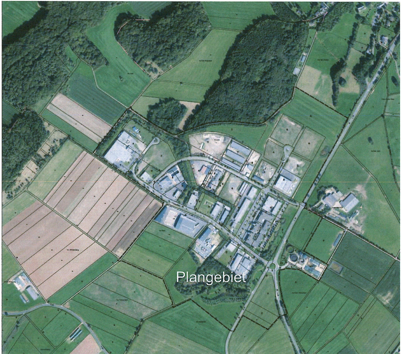
Abb. 2: Abgrenzung Geltungsbereich der 8. Änderung des Bebauungsplanes IGP Wiesbaum