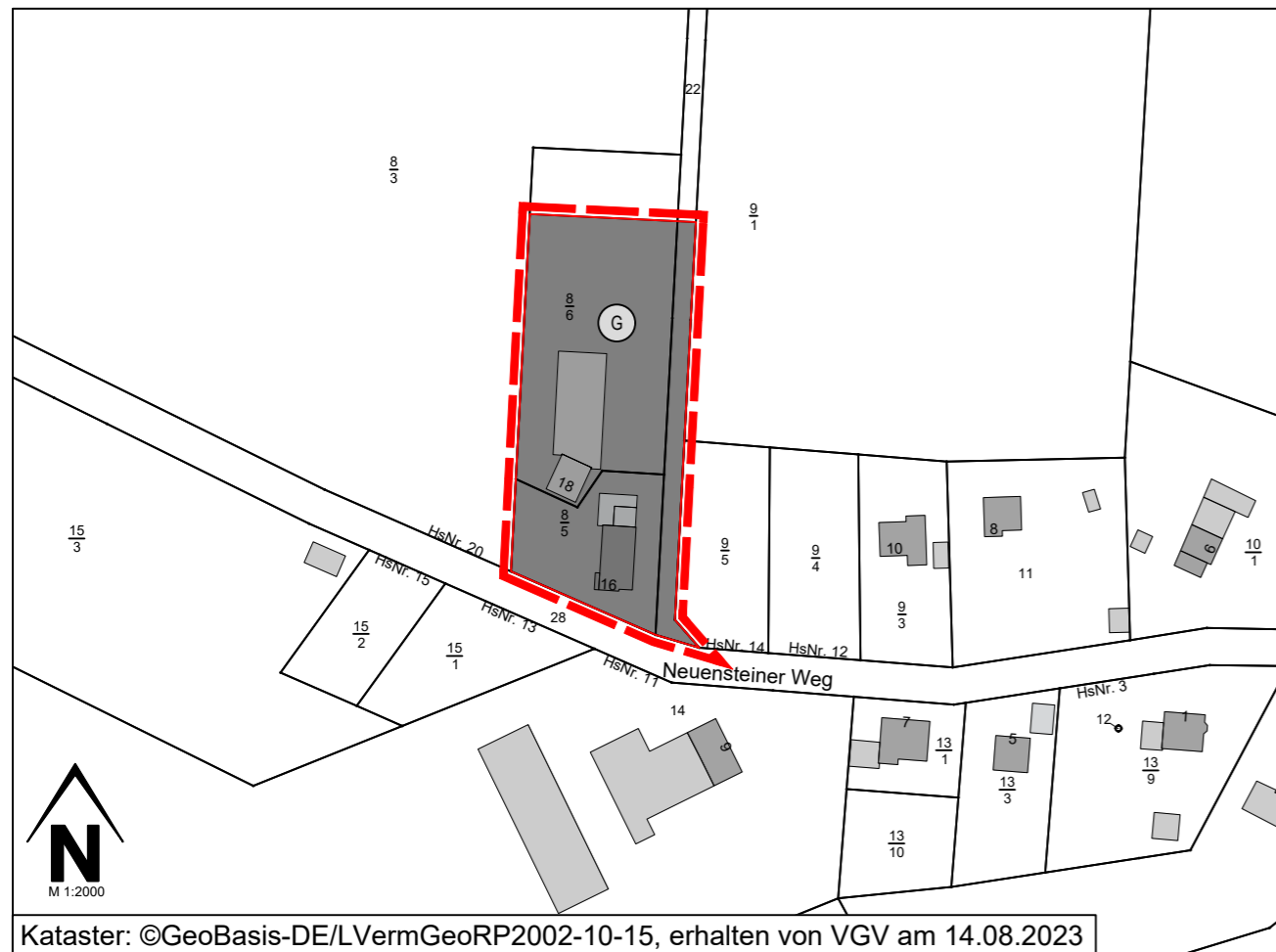
Kataster