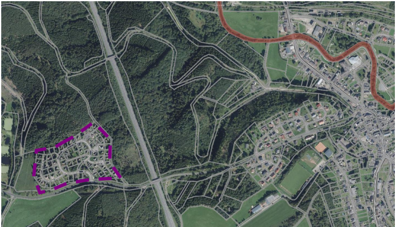
Abbildung 1: FFH-Gebiet „Obere Kyll und Kalkmulden der Nordeifel“ (Quelle: LANIS 2025 – gestrichelt dargestellt ist die Lage des Plangebiets | eigene Darstellung | ohne Maßstab)

Das Plangebiet befindet sich in einer Entfernung von rd. 650 m Luftlinie zum nordöstlich gelegenen FFH-Gebiet Nr. 7000-028 „Obere Kyll und Kalkmulden der Nordeifel“ (vgl. Abbildung 1) mit geschützten Tierarten und Lebensraumtypen. Unter Berücksichtigung der Lage des Plangebiets und der Entfernung zum FFH-Gebiet ist nicht von einer Beeinträchtigung des Schutzgebiets auszugehen, zumal die Bebauung und Nutzung nicht durch die vorliegende Planung initiiert wird, sondern bereits seit Jahrzehnten besteht.